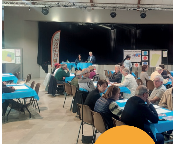
Conseil de quartier