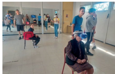
Plateau gaming avec réalité virtuelle