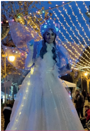
Animation proposée lors des animations de Noël

Durant les travaux Place de la Libération, le marché de plein vent du vendredi matin a été déplacé devant l'école Paul Langevin.