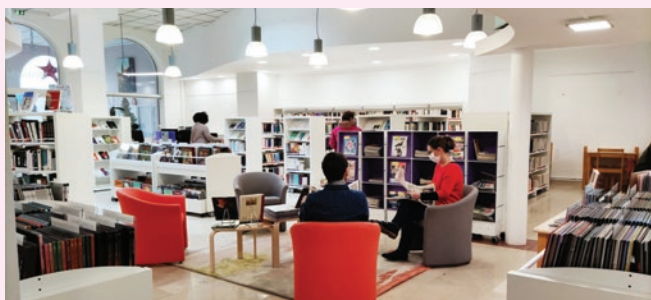
La médiathèque La Ruche