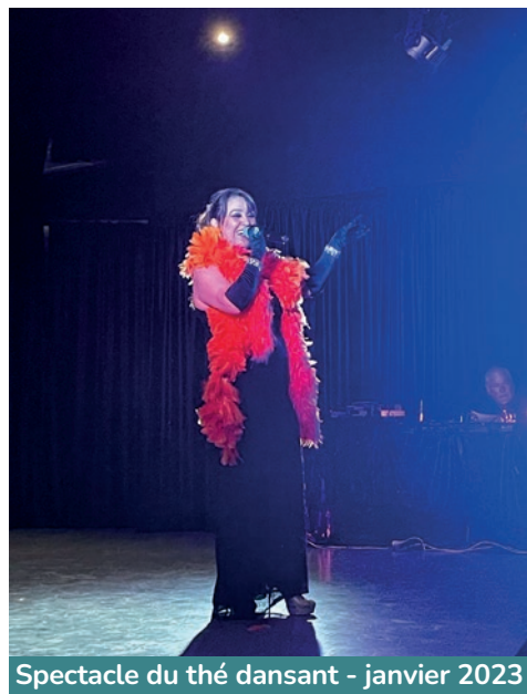
Spectacle du thé dansant - janvier 2023