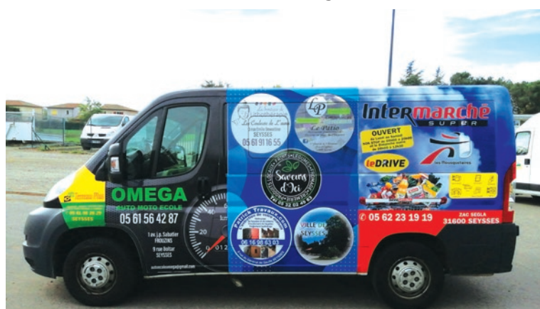
La navette communale prêtée aux associations