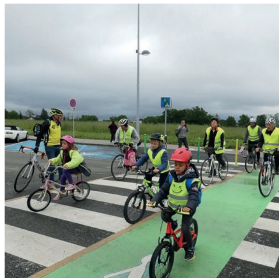
Opération « Tous à l'école à Vélo »,

Depuis, de nombreux ateliers sportifs et de sensibilisation ont pu prendre forme. L'opération « Tous à l'école à vélo » en partenariat avec le Seysses vélo club a également été mise en place pendant ce mandat. Elle permet aux élèves des écoles publiques de rejoindre leur établissement scolaire en toute sécurité, encadrés par des adultes et professionnels. De plus, dans le cadre de la lutte contre la sédentarité et des actions développées autour de Terre de jeux 2024, des randonnées seniors et intergénérationnelles ont été organisées et connaissent un vrai succès.