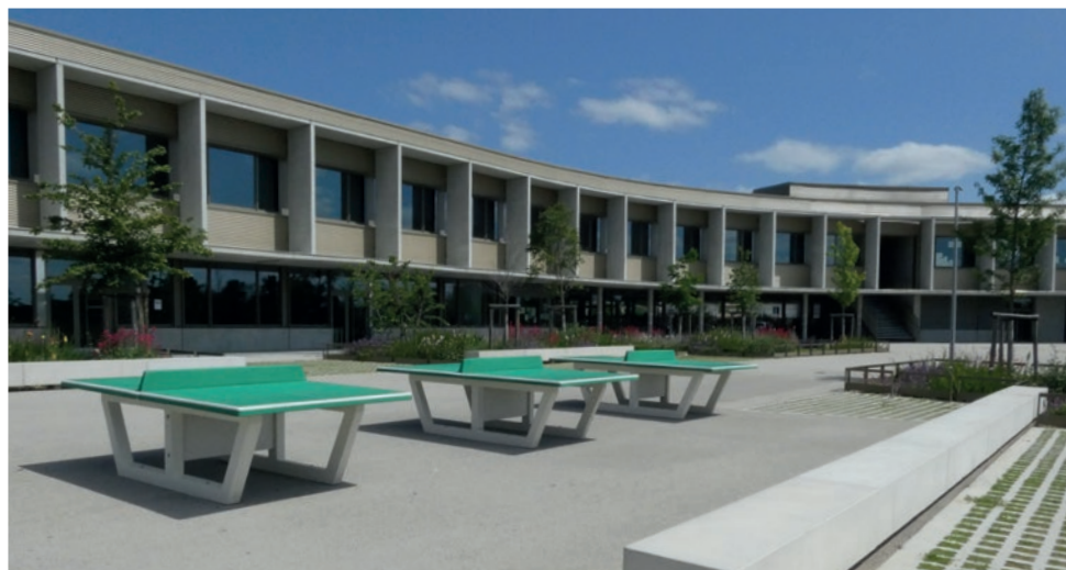
La cour du collège de Seysses au printemps

L'équipe municipale a procédé dès 2020 à une modification du PLU et des actions ont été nécessaires pour finaliser le projet. Situé route de Labastidette, le collège de Seysses a ouvert ses portes à la rentrée 2022 et profite à 400 élèves. Ce nouveau bâtiment à énergie positive propose un environnement d'études optimal pour favoriser la réussite scolaire, garantir l'égalité des chances et répondre au défi climatique.