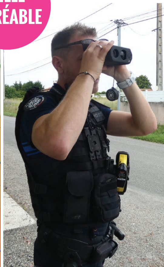
Contrôle de sécurité