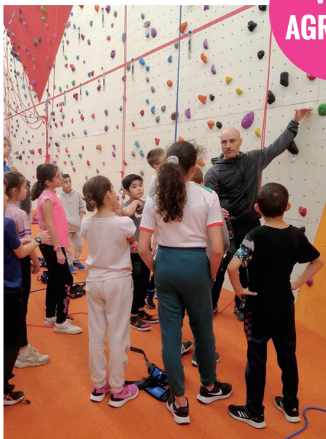
Journées sport découverte vacances