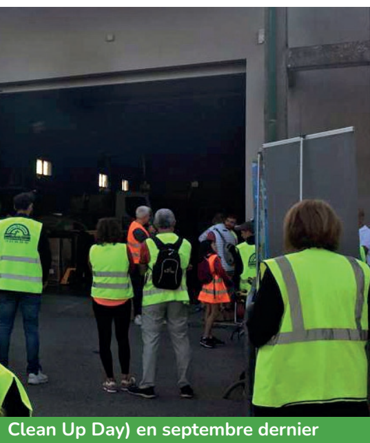
Clean Up Day) en septembre dernier