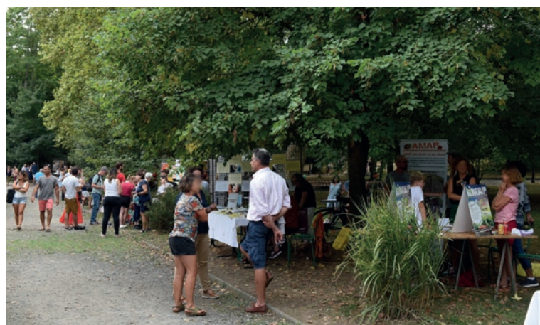
La fête des associations le 3 septembre 2022