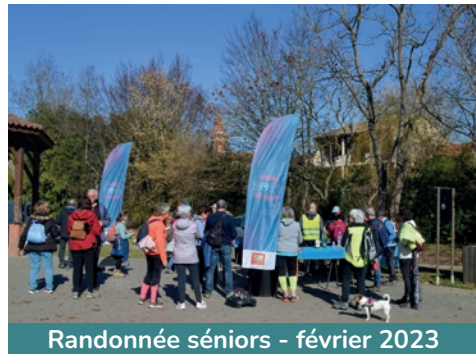
Randonnée séniors - février 2023

Les élus ont souhaité transmettre aux jeunes le désir de s'investir pour leur ville en complément des activités variées qui sont proposées tout au long de l'année. Depuis le 2 e semestre 2021, les adolescents participent à des actions solidaires (collectes alimentaires au bénéfice d'associations), environnementales (nettoyage de la ville, fabrication de nids à chauve-souris), festives (organisation du Seys'Tival) et artistiques (décoration des ronds-points, graffs).