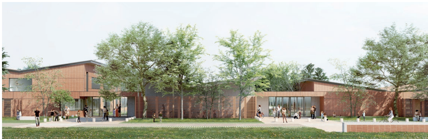
Projection du nouveau groupe scolaire