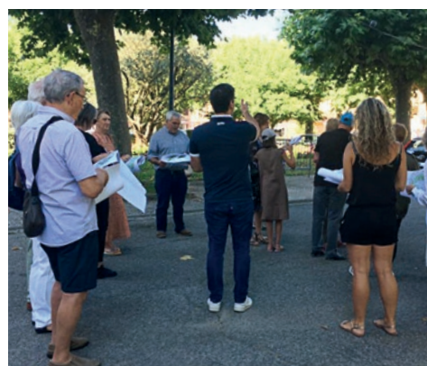
Balade urbaine place de la Libération