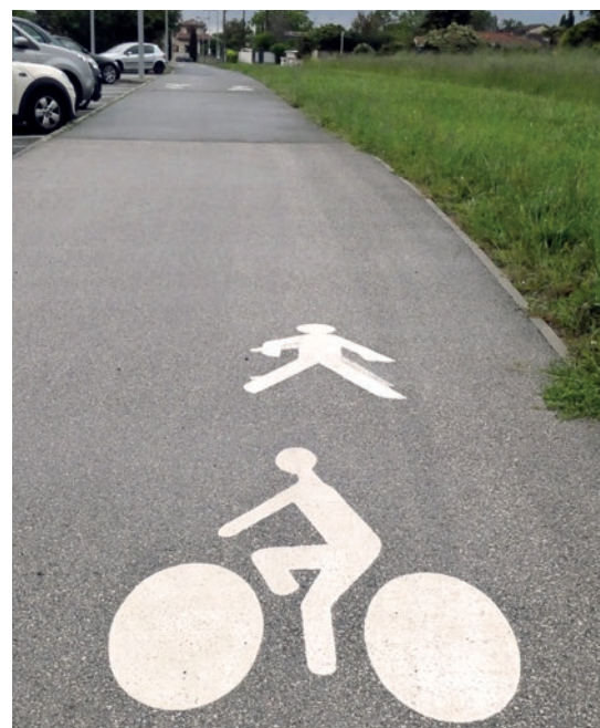
Voie partagée piétons-vélos vers le collège