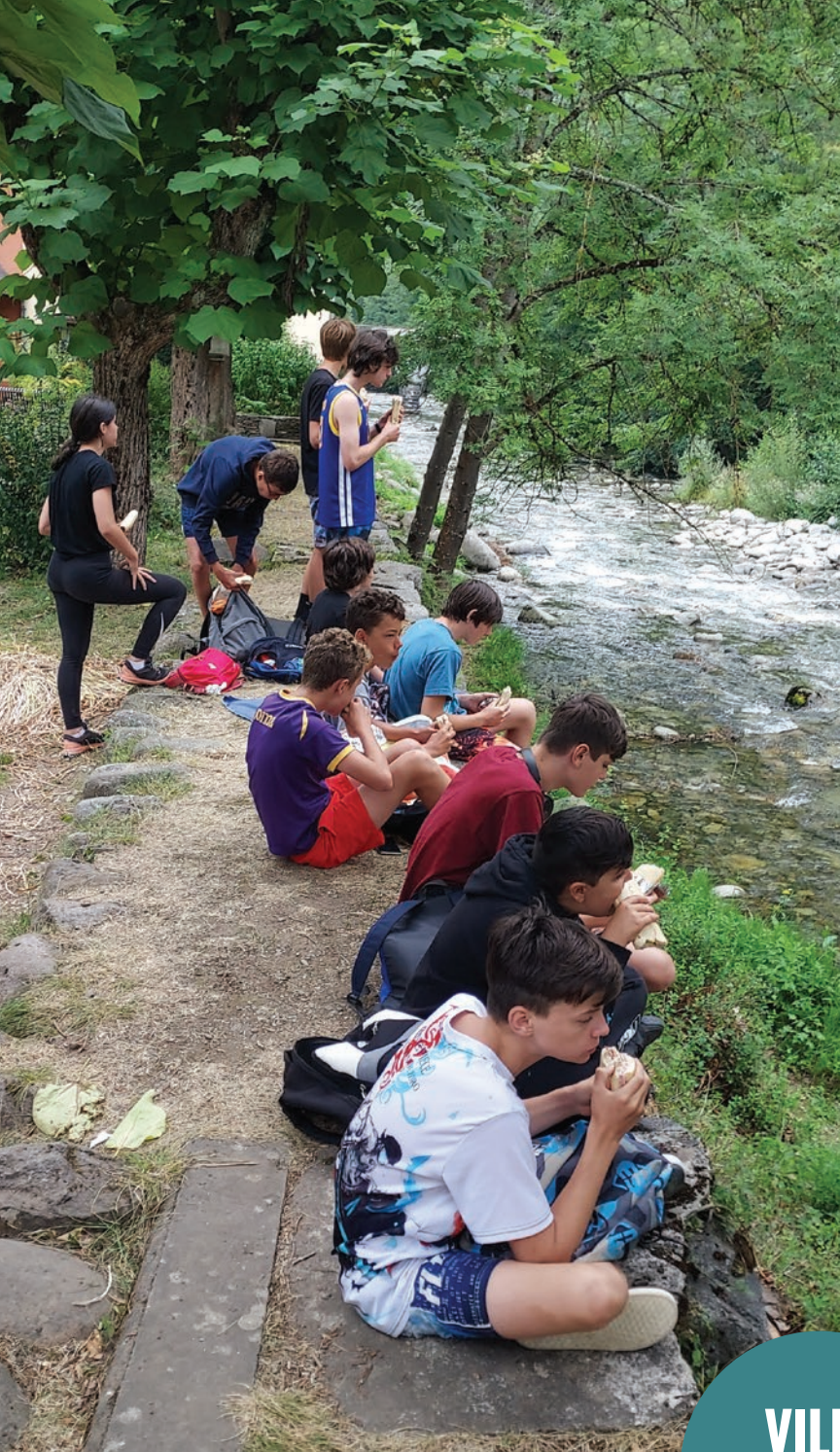
Séjour en Ariège du PAJ - été 2022