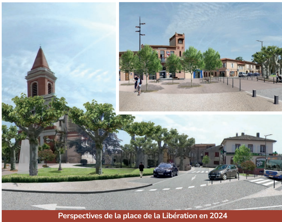
Perspectives de la place de la Libération en 2024

Depuis 2020, la municipalité travaille sur la construction d'un 3 e groupe scolaire qui sera situé chemin du Château d'Eau. Les démarches administratives sont achevées et le retour du diagnostic archéologique du terrain permettra de programmer le démarrage des travaux. En attendant son ouverture prévue pour la rentrée 2025 , la gestion actuelle des inscriptions ainsi que l'ouverture récente de 6 classes permettront de faire face à l'augmentation des effectifs dans les écoles.