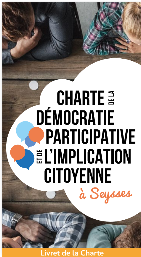
Livret de la Charte

restitution et une analyse des mobilités à Seysses en vue de définir un plan mobilités en 2022 .