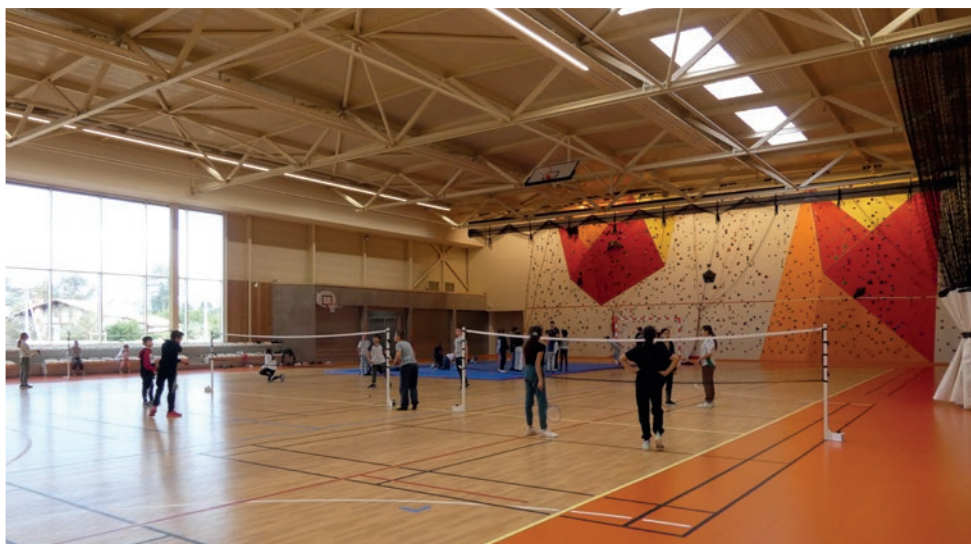
Utilisation du nouveau complexe sportif par l'école municipale des sports, les écoles de la ville et les associations

Situé derrière l'école Flora Tristan et à proximité du collège, le complexe sportif de Seysses de 2 600 m 2 a ouvert ses portes fin 2022. Ce nouvel équipement, qui sera inauguré le 1 er juillet 2023, permet de désengorger les autres structures sportives de la commune et donne un nouveau souffle à l'école municipale des sports, aux écoles de la ville, aux associations et aux Seyssois.