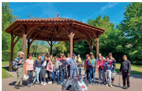
Randonnée avec ramassage de déchets

Cette année, les adolescents du Point Action Jeunes et les seniors se sont réunis autour de la 1 ère édition de la semaine intergénérationnelle . Ils ont participé à différentes animations en vivant de véritables moments de partage.