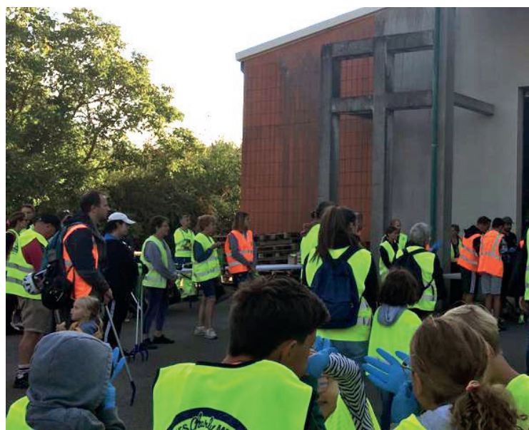
La journée mondiale du nettoyage de la planète (World