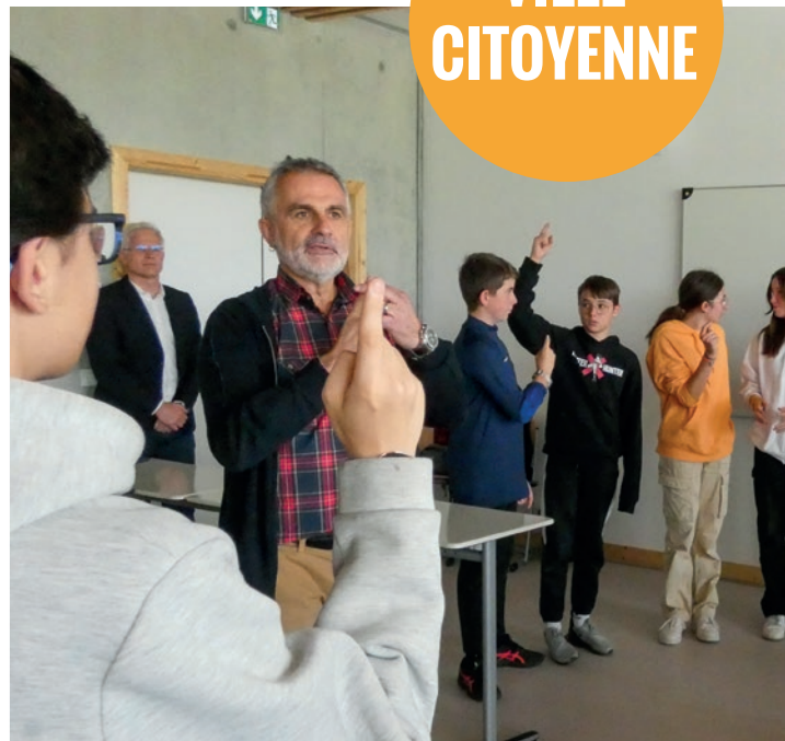
Entraînement pour le Challenge de