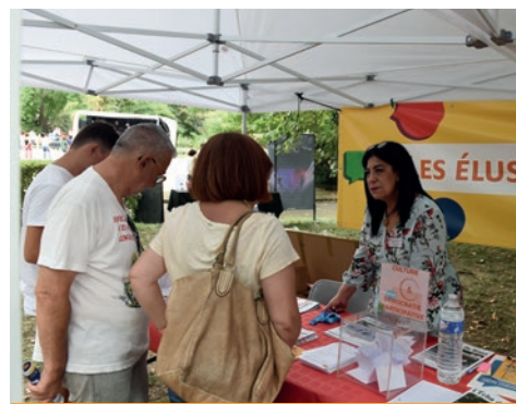
Un projet culturel de la ville