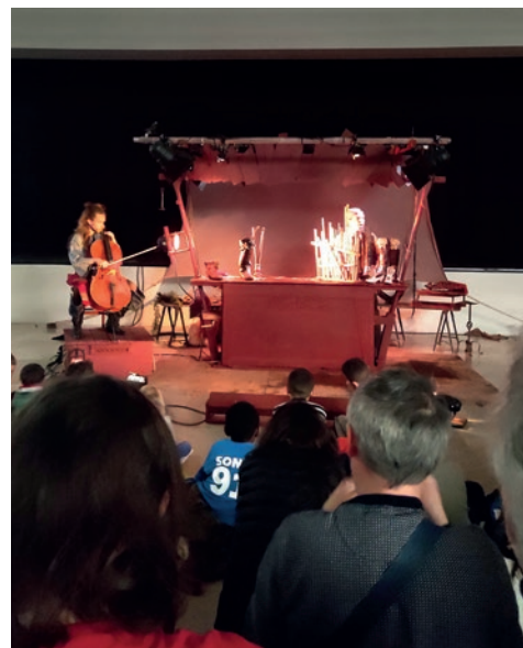
Spectacle « L'île au Trésor » donné à la salle des fêtes le 16 avril 2023