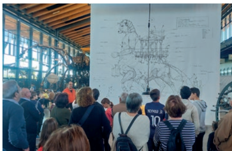
Visite Halle de la Machine à Toulouse