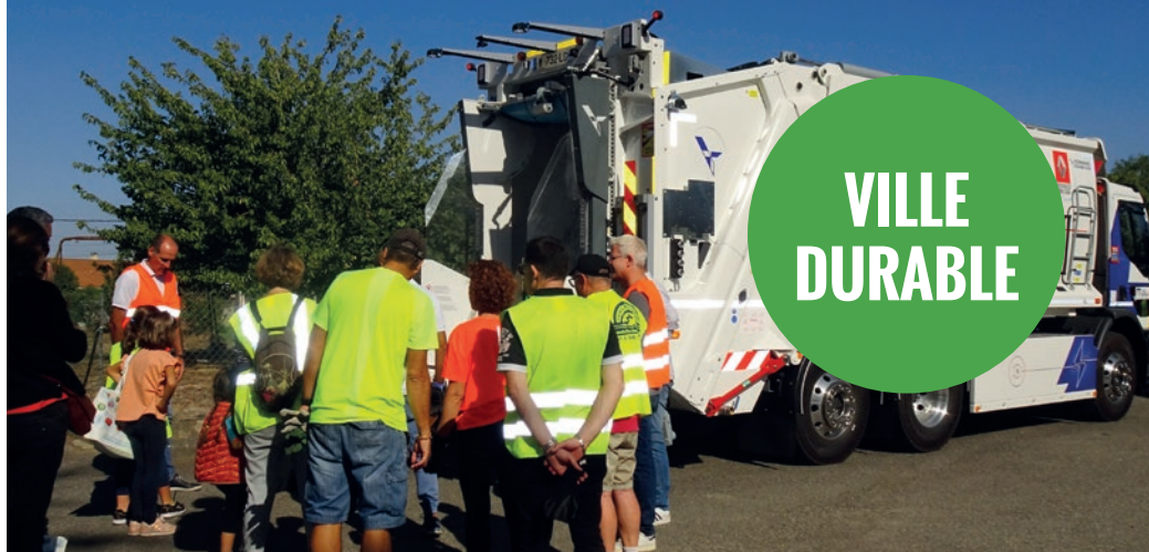
Participation de la ville à la journée mondiale du nettoyage de la planète