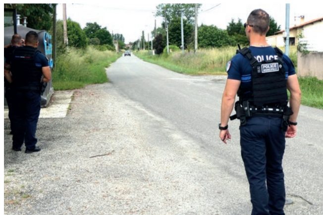
Un 3 e policier municipal

Les caméras seront installées avant la fin du mandat dans les secteurs ciblés et viendront renforcer le travail de la police municipale sur la commune.