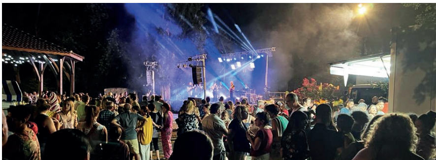
Concert du 13 juillet 2022 au parc de la Bourdette

PAR L'ORGANISATION DE CES ÉVÉNEMENTS, LA MUNICIPALITÉ CONFIRME SA VOLONTÉ DE FAIRE DE SEYSSSES UNE VILLE DYNAMIQUE.