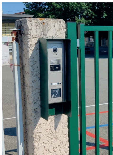
Des visiophones pour les écoles

La police municipale compte dorénavant 3 policiers municipaux afin de répondre au mieux aux attentes des habitants.