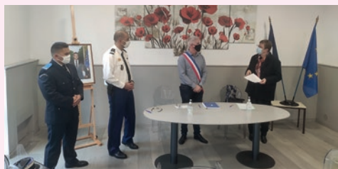
Signature de la convention

Une convention de coordination entre les forces de sécurité de l'Etat et la commune de Seysses a été signée en décembre 2021. Ce partenariat fixe le rôle de chacune des entités relatives à la lutte contre la délinquance sur la commune . Depuis janvier 2023, cette collaboration s'est accentuée avec la tenue de réunions hebdomadaires dédiées à la sécurité des Seyssois tout en favorisant les échanges d'informations.