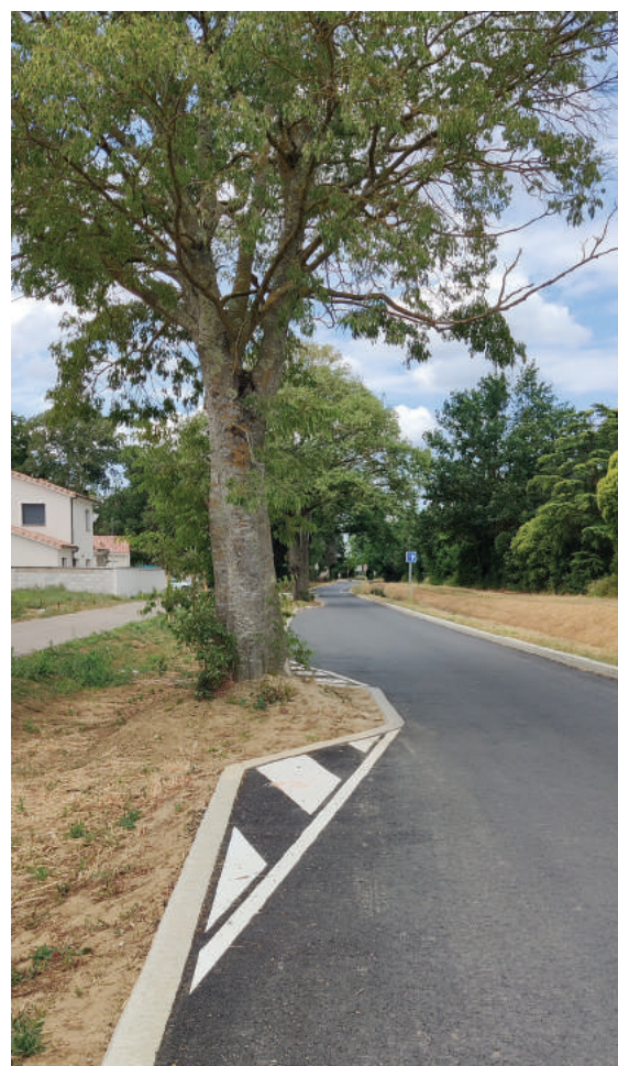
Requalification du chemin du Château d'Eau - Février 2022

Après l'embauche d'un 1 er policier municipal en décembre 2020, un 2 ème agent a intégré les effectifs en août 2021. Enfin, la police municipale de Seysses s'est renforcée avec l'arrivée d'un 3 ème policier municipal qui a pris ses fonctions début mars 2022. La police municipale compte dorénavant 3 policiers municipaux afin de répondre au mieux aux attentes des habitants.