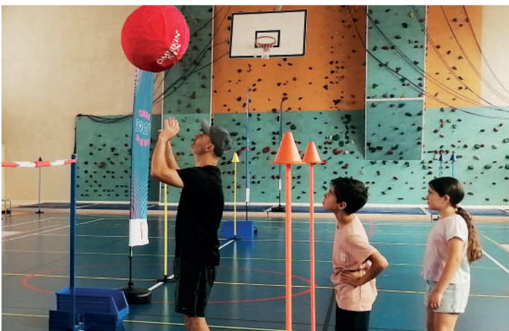
es écoles - Juin 2022