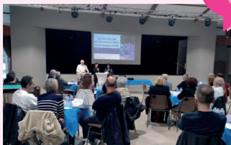
Réunion des associations Avril 2022

Sur l'initiative des élus et le temps d'une soirée, ce rendez-vous annuel permet à la municipalité de présenter les projets sur l'année à venir. Ce moment d'échange donne également aux associations l'occasion de se rencontrer, de présenter leurs activités et d'aborder leurs difficultés.