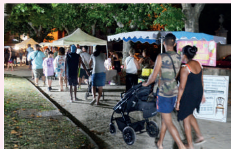
Marché nocturne - Septembre 2021

Au nombre de 3 par an, les marchés nocturnes organisés par la mairie depuis septembre 2021 sont un véritable succès. À chaque édition, les nombreux visiteurs peuvent découvrir près de 50 exposants.