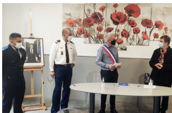
Signature de la convention Décembre 2021