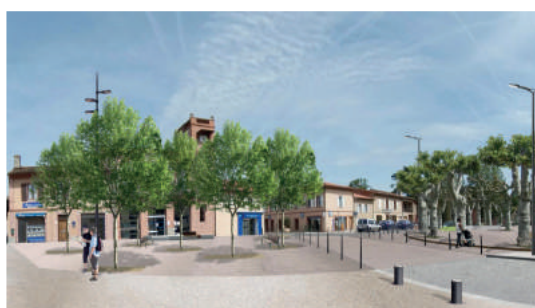
Projet de rénovation du centre-ville Urbanlink