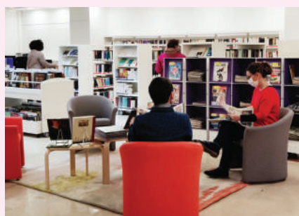
La médiathèque La Ruche

Une convention avec chaque école de la Ville a été signée pour proposer des animations pendant l'année scolaire.