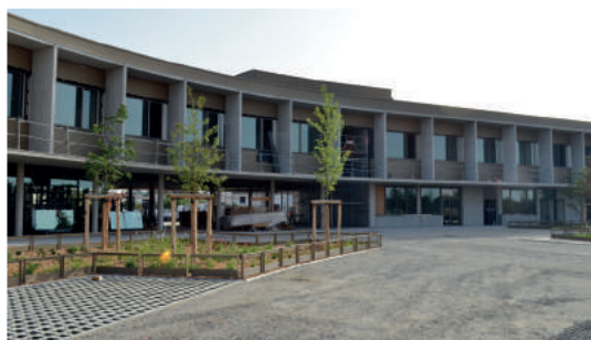
Construction en cours du collège Juin 2022