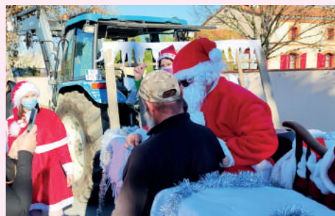
Venue du Père-Noël - Décembre 2021

Pour la 2 ème année consécutive, la municipalité a proposé pendant tout le mois de décembre de nombreuses animations (venue du Père-Noël, goûter de Noël dans les écoles, spectacles, marché de Noël, calendrier de l'avent avec les commerçants, illuminations...).