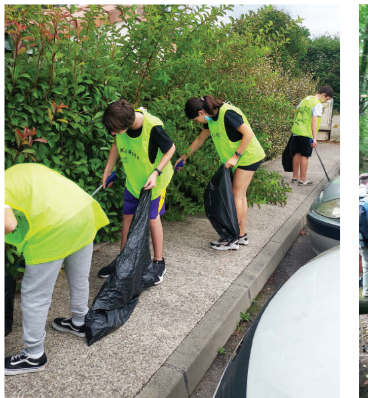
Nettoyage de la Ville par le PAJ - Septembre 2021