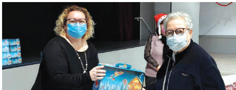
Distribution des colis de Noël par le CCAS (2) - Décembre 2021