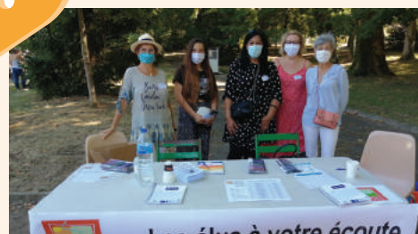
Stand des élus - Septembre 2020/2021

Dans la mesure du possible, un stand des élus est présent sur les grands événements organisés par la Mairie dans le but de rencontrer les Seyssois et d'échanger avec eux.