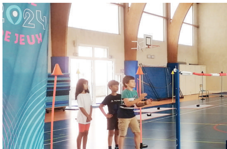
Olympiades dans les écoles

L'inscription sur le fichier nominatif est désormais possible toute l'année. Les 260 personnes inscrites reçoivent des appels au minimum 2 fois par an et des visites à domicile sont organisées sur simple demande.