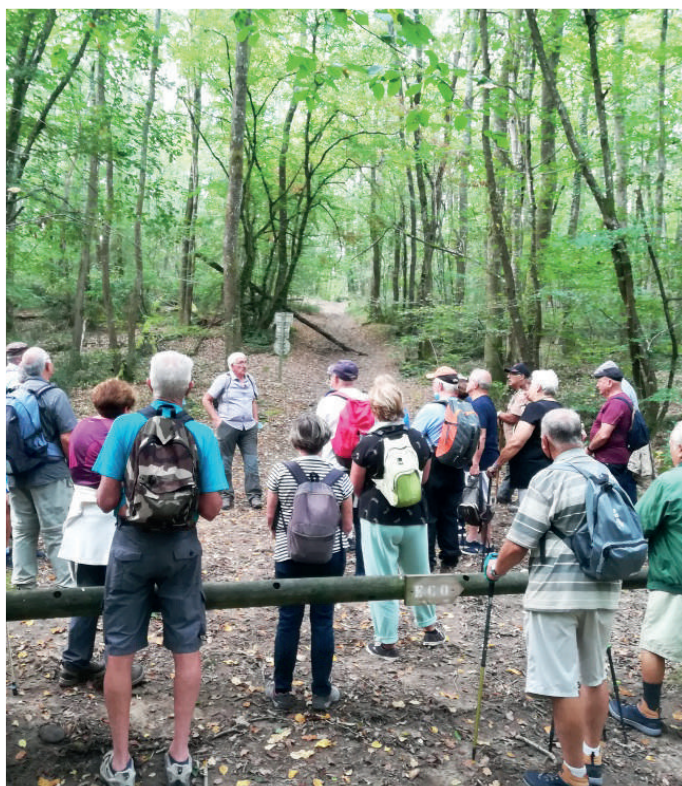
Sorties seniors Bouconne - Septembre 2021

Distribution en 2020 de plus de 9 600 masques aux seyssois, aux élèves des écoles élémentaires de la ville et aux professionnels dans les écoles.