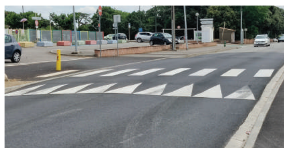
Plateau ralentisseur - Mai 2022