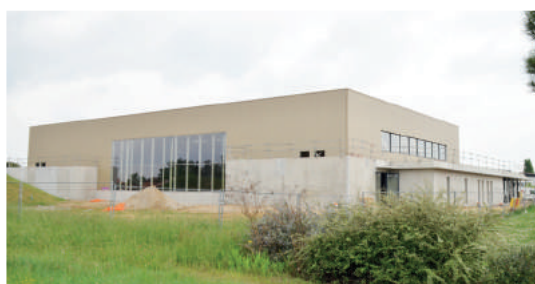
Construction en cours du gymnase Mai 2022