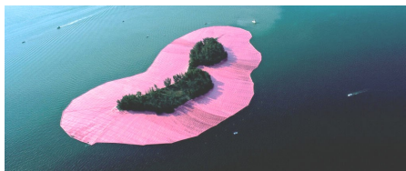
« Baie de Biscayne, Floride, 1983 »

05 62 23 00 63 culture@mairie-seysses.fr