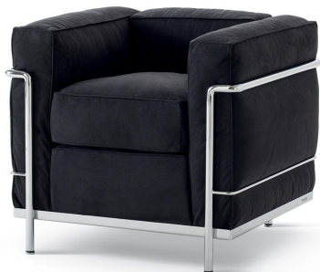
« Fauteuil LC2, Le Corbusier, 1965 » Designer : Jeanneret / Perriand

Le temps d'une soirée, rendons justice à cette femme libre et l'une des personnalités phares du monde du design qui a contribué à mettre les avancées modernes au service du plus grand nombre.