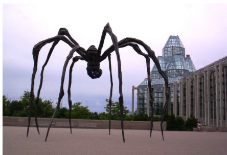
« Sculpture Maman » Musée des beaux-arts, Canada

Son travail d'artiste est reconnu tardivement et elle est considérée comme particulièrement influente sur les générations d'artistes ultérieures, surtout féminines.