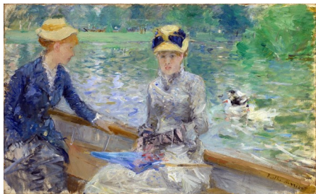
« Jour d'été (Morisot), 1879 » National Gallery, Londres

05 62 23 00 63 culture@mairie-seyssel.fr