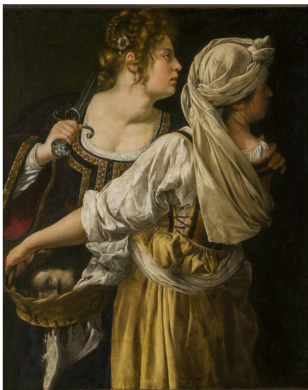
« Judith et sa servante, vers 1619 » Palais Pitti, Florence

05 62 23 00 63 culture@mairie-seysses.fr