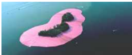
« Baie de Biscayne, Floride, 1983 »

05 62 23 00 63 culture@mairie-seysses.fr