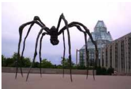
« Sculpture Maman, vers 1969 » Musée des beaux-arts, Canada

Son travail d'artiste est reconnu tardivement et elle est considérée comme particulièrement influente sur les générations d'artistes ultérieures, surtout féminines.