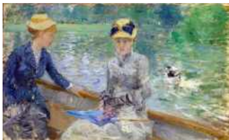
« Jour d'été (Morisot), 1879 » National Gallery, Londres

Ses œuvres se trouvaient, pour la plupart, dans des collections privées mais cette artiste fut redécouverte au début du XXIe siècle, à la faveur d'expositions consacrées à l'impressionnisme.