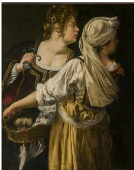
« Judith et sa servante, vers 1619 » Palais Pitti, Florence

05 62 23 00 63 culture@mairie-seysses.fr