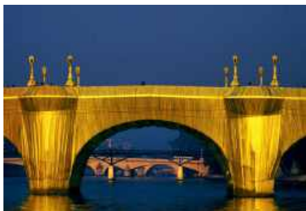
« Le Pont-Neuf, Paris, 1985 »