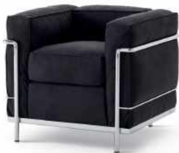
« Fauteuil LC2, Le Corbusier, 1965 » Designer : Jeanneret / Perriand

Le temps d'une soirée, rendons justice à cette femme libre et l'une des personnalités phares du monde du design qui a contribué à mettre les avancées modernes au service du plus grand nombre.