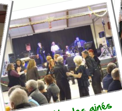
Galette des aînés