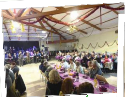
Galette des aînés