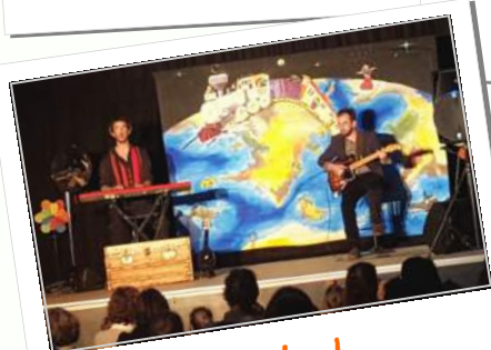
Spectacle Le petit train du bonheur

Toutes les photos sont disponibles sur le site www.mairie-seysses.fr Rubrique Albums photos