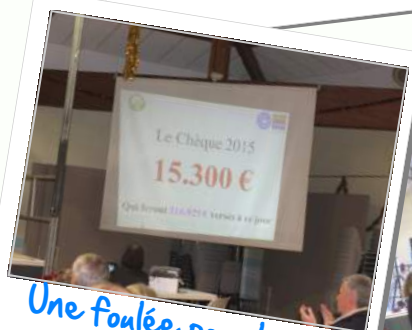
Une foulée pour la vie Remise des chèques