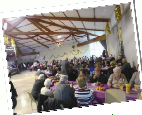
Galette des aînés