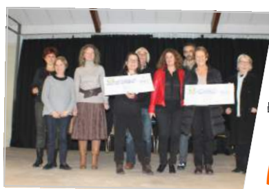
Une foulée pour la vie Remise des chèques