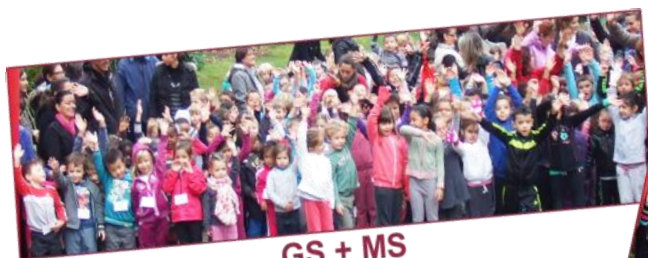
GS + MS

972 élèves, 2328.60 km parcourus 1170.51 € collectés