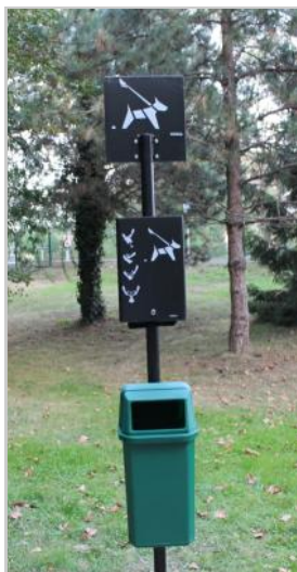
Coût des 9 bornes : 2 331 € TTC

Des "sani-canins" (distributeurs de sacs pour ramasser les déjections canines) ont été placés sur les lieux de promenade et de fréquentation des chiens ( matérialisés par un point rouge sur les photos ci-dessous ).