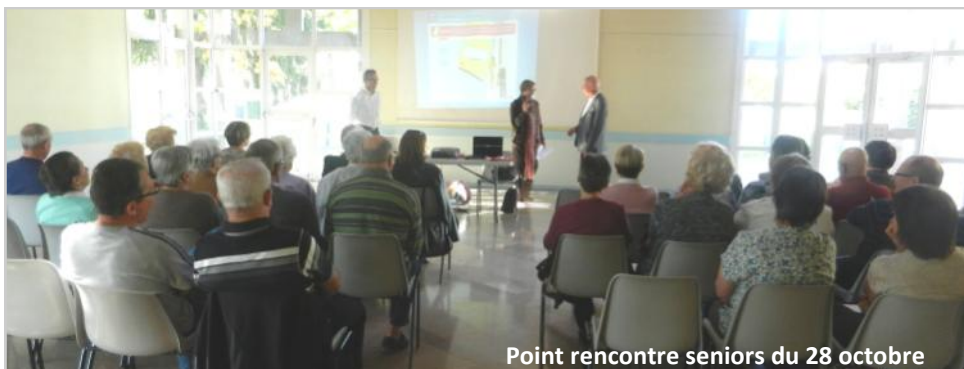
Point rencontre seniors du 28 octobre

Le CCAS (Centre Communal d'Action Sociale) organise tous les semestres un Point Rencontre Seniors (PRS) autour d'un thème.