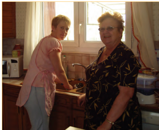
L'aide à domicile vous aide dans vos actes quotidiens.

Pour tout renseignement, contactez le SIAS au 05.61.56.18.00.