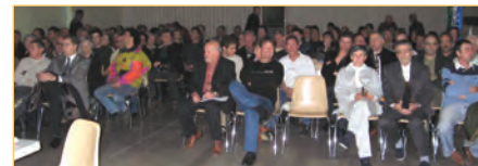
L'assistance était nombreuse lors de la présentation du PADD.

Petite séance de rattrapage pour les personnes qui n'ont pas pu être là :